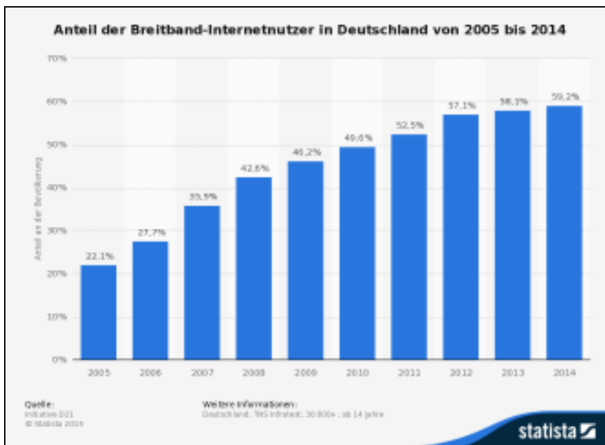
Abbildung 5: Breitbandnutzer 2005-2014.

Mit der Zahl der Nutzer stieg gleichzeitig auch kontinuierlich die Zahl derer, die Breitbandinternet nutzen in den letzten Jahren deutlich an. Breitband ist für einen modernen und innovativen Lebens- und Arbeitsstandort wichtig und wird von Unternehmen als notwendige Infrastruktur, als "Lebensader" (Die Wirtschaft, 05/2013, IHK Ulm: Link ), wahrgenommen.