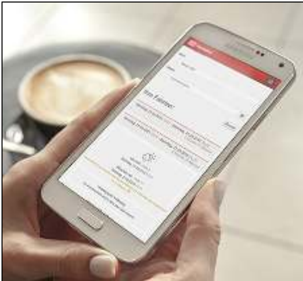
Abbildung 2: Ergebnis eines Hackdays der Deutschen Bahn 2015