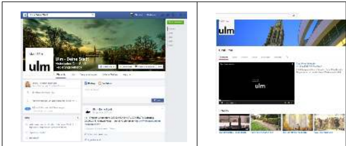
▪ Abbildung 1: Die Stadt Ulm auf Facebook und Youtube