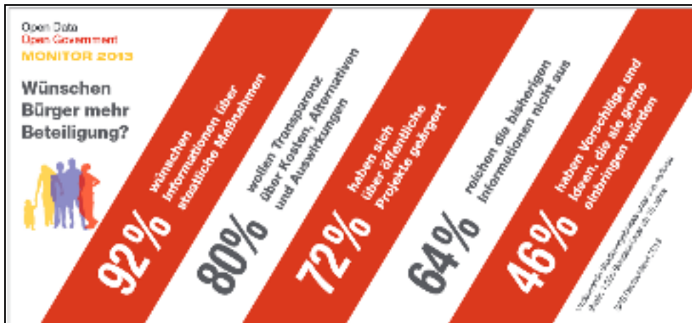
Abbildung 8: Studie SAS, 2013, S. 4; Link .

Mit dem Zugang zum Internet, und dem wachsenden Thema der Digitalisierung sowie den grundlegenden Veränderungen in der politischen Landschaft kommt der wachsende Wunsch nach mehr Transparenz und Beteiligung der Bürgerschaft gegenüber dem Staat auf. Dies wurde nach einer ersten Studie 2011 auch in 2013 nochmals von der SAS erhoben: